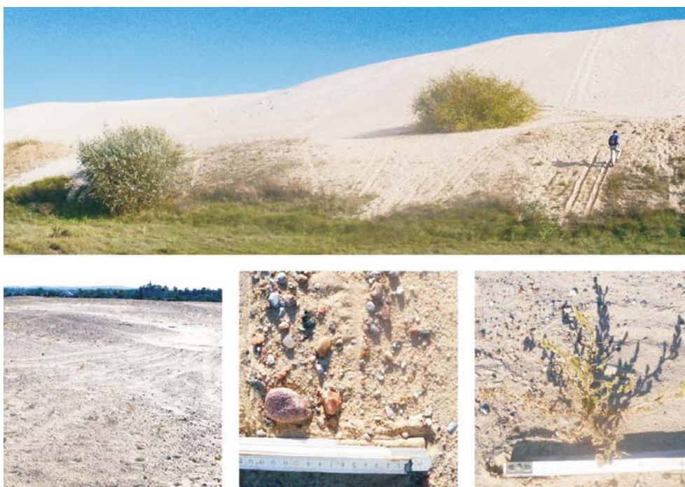
Rys. 5. Złoże antropogeniczne Bilczew – piaski czwartorzędowe

Skład mineralny piasków ze złoża antropogenicznego Bilczew jest typowy dla osadów czwartorzędowych pochodzenia wodnolodowcowego. Dominuje wśród nich kwarc, a udział np. skaleni, amfiboli i piroksenów jest zauważalny. We frakcji żwirowej łatwo można dostrzec okruchy mezozoicznych i paleogeńsko-neogeńskich skał osadowych – dolomity, wapień, piaskowce i inne, jak i prekambryjskie skały krystaliczne – granity, granitognejsy, gnejsy, porfiry itd. (rys. 5).