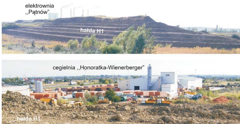
Rys. 2. Złoże antropogeniczne Honoratka – ropy neogeńskie

Łącznie w złożu antropogenicznym Honoratka, w ciągu 25 lat jego istnienia, odłożono około 4,1 mln m 3 neogeńskich kopalin. Z tego ropy nadwęglowe stanowiły blisko 3,0 mln m 3 ,