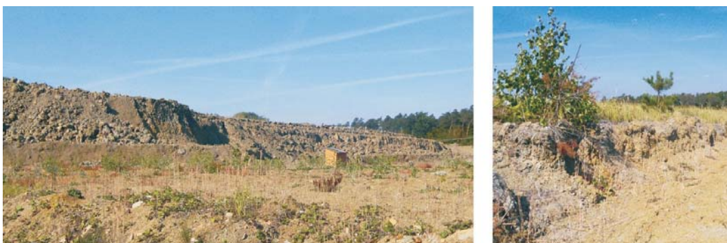
Rys. 4. Złoże antropogeniczne Kleczew – iły neogeńskie

W uśrednionym składzie mineralnym ilów nadkładowych z konińskich odkrywek, w tym z odkrywki Kazimierz N i Pątnów, dominuje smektyt (beidelit) – ~60%. Ponadto współwystępują z nim następujące minerały: illit – ~10%, kaolinit – ~6% i kwarc – ~24%. Natomiast przedziały zmienności uziarnienia omawianych ilów są następujące: frakcja ilasta – 37–64%, frakcja pylasta – 5–40% i frakcja piaszczysta – 10–20% (np. Gradecki 1997). Warto też wspomnieć, że w wielu próbkach przekroczona jest dopuszczalna zawartość węglanów (margla) i siarczanów (gipsu). Niemniej jednak w wyniku składowania margiel i gips częściowo ulegają rozkładowi, co poprawia jakość surowca przeznaczonego